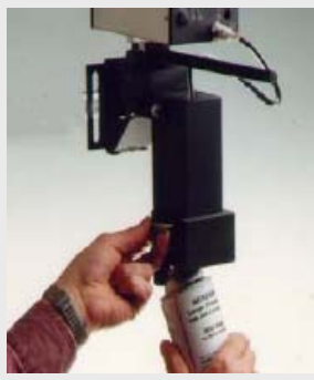
Pas de manipulation d'encre