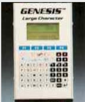
Simplicité du clavier