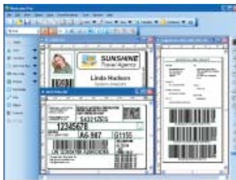
Créer, maintenir et imprimer toutes vos étiquettes (standard ou non) en quelques minutes.

Vous disposez d'un contrôle total des données de vos étiquettes grâce aux nombreuses configurations et fonctionnalités avancées: impression multilingue (UNICODE), validation des données clavier, champs liés ou même les scripts Visual Basic (VBScript), écriture d'informations dans les Tags RFID. NiceLabel inclut les derniers codes à barres linéaires et 2D.