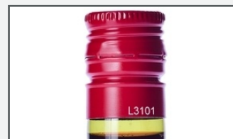
Marquage sur métal